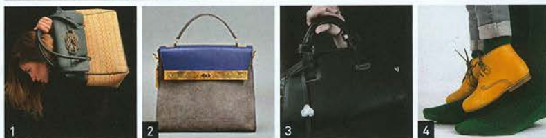
Parmi les bénéficiaires du tout nouveau programme Au-delà du cuir (ADC), on compte Laema (1), Yvonne Yvonne (2) et Valery Damnon (3) en maroquinerie, et Clotaire (4) pour la chaussure.

A vec 413 exposants, soit une hausse de + 17 % par rapport à septembre 2011, Le Cuir à Paris reste sur une dynamique de succès. Les professionnels continuent de plébisciter cette place de marché qui les met en relation avec le must de la clientèle européenne et internationale de la mode, des accessoires et de la maison. Et ce n'est pas la proportion de la puissante corporation des tanneurs italiens – qui progresse encore de 31 % cette session avec 205 exposants présents – qui démentira cet élan.